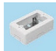
1 個用スイッチ BOX